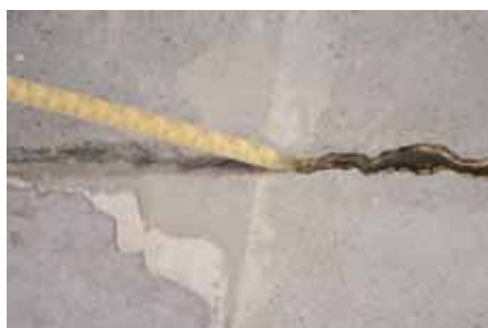
2 : Comblant la fissure