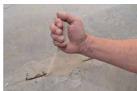
3 : Sablage à refus