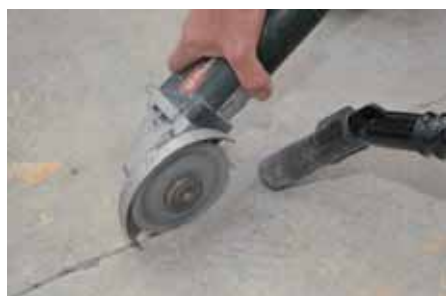
1 : Ouverture de la fissure